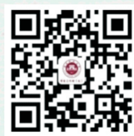
福建师范大学 学工处微博